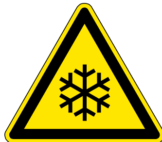
Warnung vor Kälte

CO 2 -Flaschen ohne Steigrohr müssen zur Gasentnahme mit einem Druckminderer betrieben werden, um den Druck auf das für den Anwendungszweck zulässige Maß zu reduzieren. CO 2 -Flaschen ohne Steigrohr müssen zur Gasentnahme aufrecht stehend betrieben werden. Aus einer liegenden Flasche würde flüssiges CO 2 ausströmen, was zum Verstopfen der Entnahmeeinrichtung mit CO 2 -Schnee führen könnte. Die Entnahmegeschwindigkeit aus CO 2 -Flaschen ohne Steigrohr ist begrenzt, weil das CO 2 aus der Flüssigphase verdampfen muss.